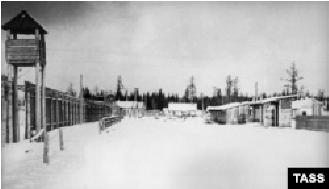
Табір для репресованих. Сибір

Прибули на місце 1 травня 1940 року (етапування тривало 4 місяці – ред.). Бараки для них були вже побудовані.