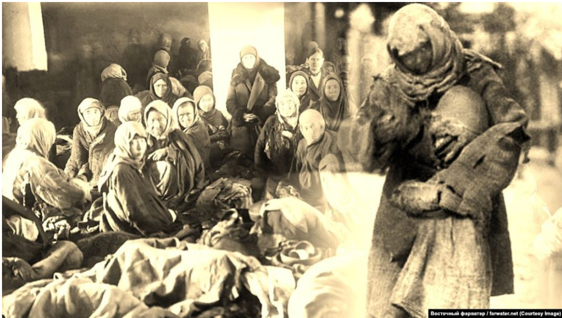
Розкуркулення, а тоді Голодомор 1932–1933 років

«Життя поділилося на до і після», «нічого так не хотіла, як ще раз походити по своїй землі», «працювали усією родиною важко, але мали і хліб, і до хліба», «усе життя мовчав, аж перед смертю розказав», «дуже тяжко ненавиділа совети»... Дослівно такі, або ж дуже подібні на ці, словосполучення зустрічаються у розповідях, які надходять на редакційну пошту. Їх, разом із дивом збереженими світлинами і віднайденими архівними документами, надсилають нащадки тих, кому вдалося вижити під час організованих Сталіним і Комуністичною партією репресій проти українського селянства, які назвали – «розкуркуленням».