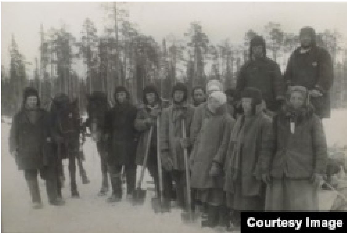
Репресовані сталінським режимом на будівництві Біломорканалу, 1932 року

Таку безправну категорію населення називали «спецпереселенцями» і використовували на найважчих роботах, де вони зазнавали нелюдських страждань. Багато з них, особливо літніх людей та дітей загинуло.