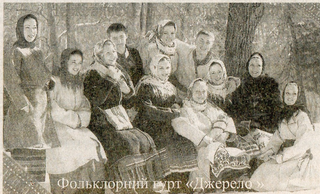
Фольклорний гурт «Джерело»