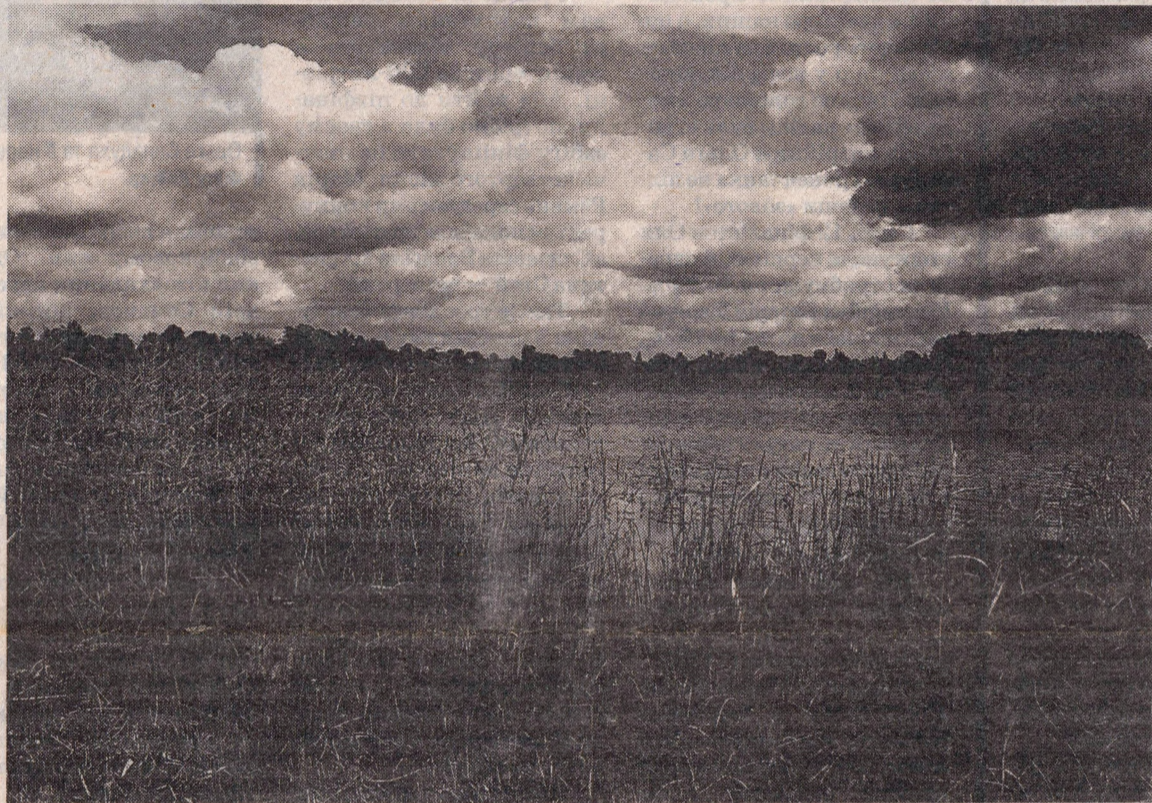
Краса, яка зачаровує. Озеро Нобель.

Узагалі Нобель є одним із найстаріших населених пунктів Зарічненщини. Вперше село згадується в Літописі Руському ще під 1158-м роком. Інша літописна згадка датується 1262 роком, коли на березі озера відбулася битва між дружиною Волинського князя Василья та ятвягами. Правда, назива-