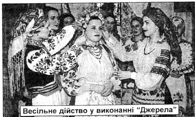
Весільне дійство у виконанні “Джерела”

- Фрагмент весільного обряду, записаного в Зарічненському районі. Крім фестивальных виступів, мали ще окремий концерт з годинною про-