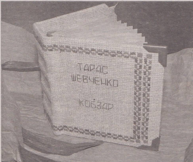
Серед мільйонів Шевченкових видань – це неповторне.