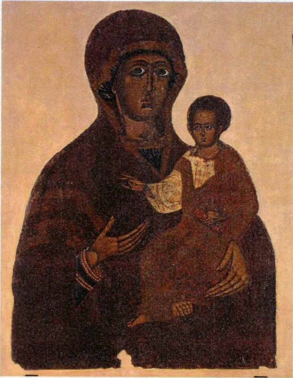
Богородиця Одигітрія Дорогобузька XIII ст. (РОКМ).