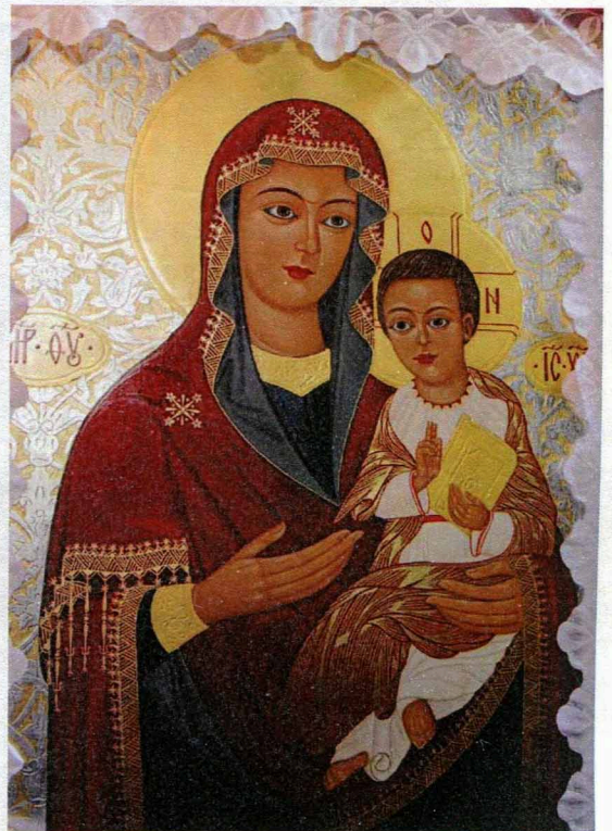
Список з ікони Пресвятої Богородиці Одигітрії Заставницької XVII ст. (Свято-Михайлівська церква смт. Гоща).