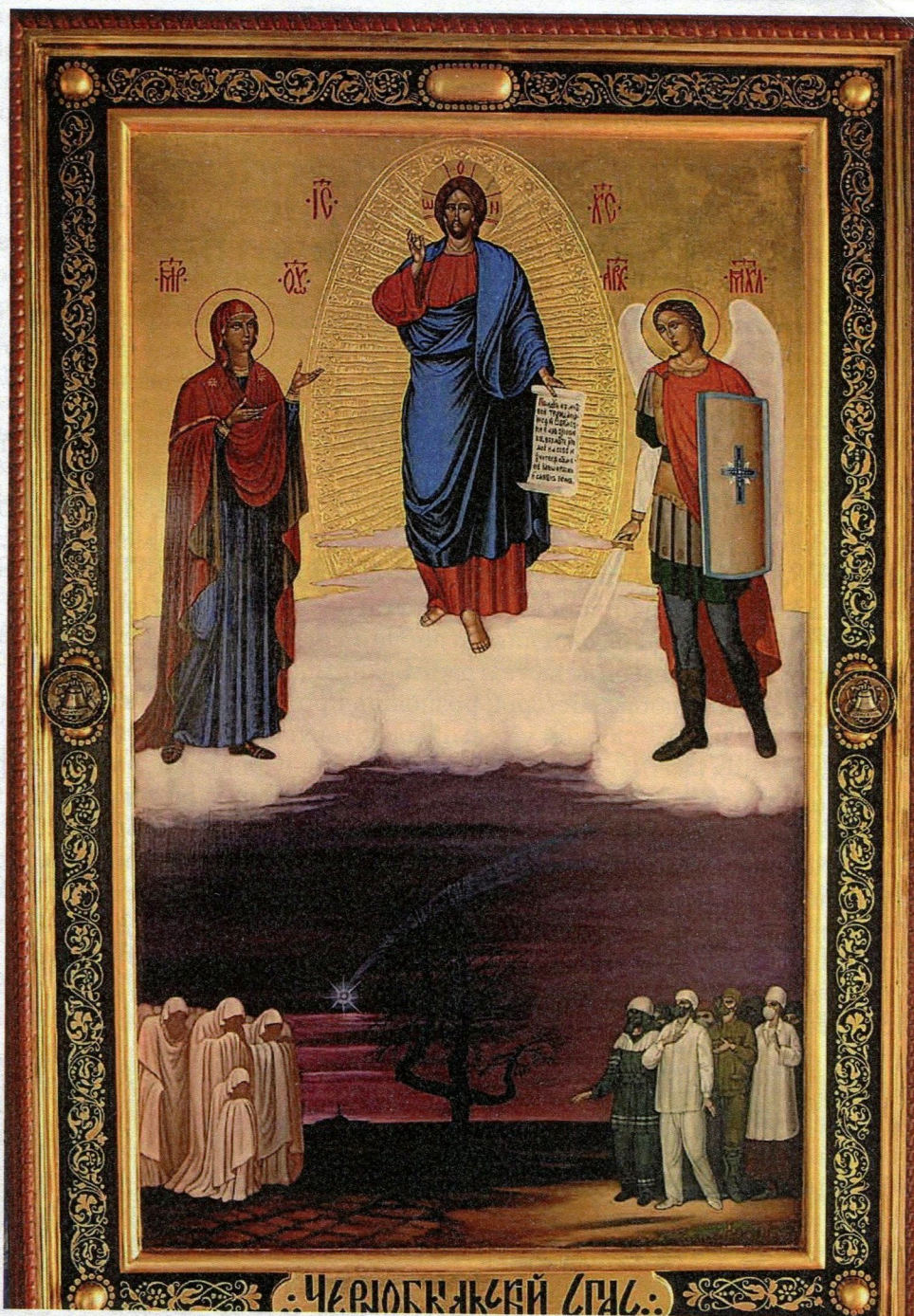
Список з ікони «Чорнобильський Спас» (Церква Великомученика і цілителя Пантелеймона м. Рівне).