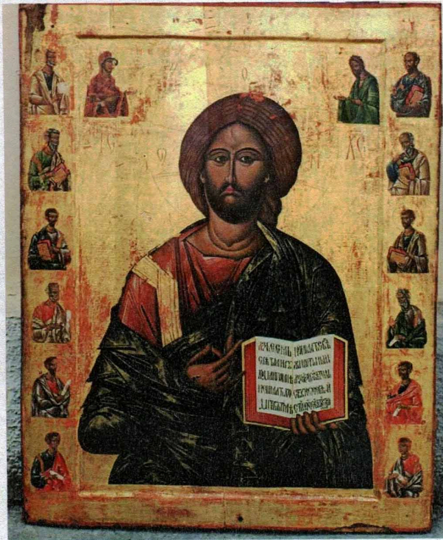
Ікона «Христос Пантократор з апостолами» XV ст. (РОКМ).