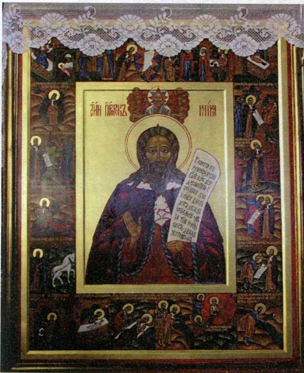
Список з ікони «Ілля пророк з житієм» XVII ст. (Свято-Іллінський чоловічий монастир м. Одеса).