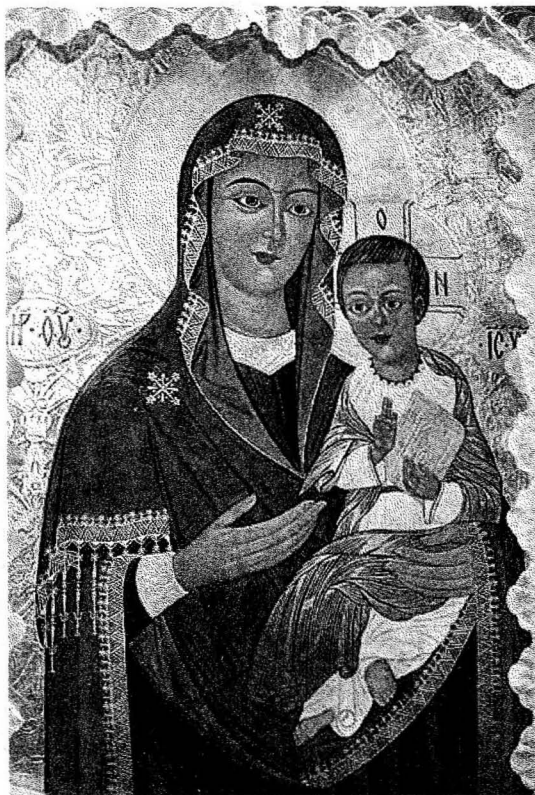
Рис 5. Список з ікони Пресвятої Богородиці Одигітрії Заставницької XVII ст. (Свято-Михайлівська церква смт. Гоща).

Копія виконана на замовлення Покровського собору в Рівному при потужній фінансовій підтримці прихожан і спонсорів. Характерно, що писалася ікона в самому соборі. Як пояснив Олександр Лаворик, це зроблено для того, щоб вона звикла до температурного режиму та того середовища, де буде знаходитись. Можливо, саме тому після освячення,