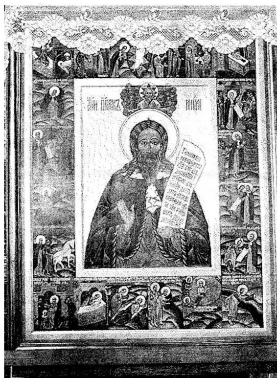
Рис 3. Список з ікони «Ілля пророк з житієм» XVII ст. (Свято-Іллінський чоловічий монастир м. Одеса).

і техніки при Кабінеті Міністрів України у складі групи фахівців пан Олександр досліджував ікони Волині. Що зберігаються в музеях України. В результаті ознайомився з колекціями ікон в Національному художньому музеї (Київ), Музеї волинської ікони (Луцьк), Острозькому краєзнавчому музеї, Національному історико-меморіальному заповіднику «Поле Берестецької битви» (с. Пляшева Радивилівського району), Львівській галереї мистецтв, Державному музеї-заповіднику «Одеський замок», Науково-мистецькій фундації митрополита А. Шептицького (Львів), Музеї народної архітектури і побуту (Львів), Тернопільському краєзнавчому музеї, Рівненському обласному краєзнавчому музеї (далі РОКМ). Саме в РОКМ митець провів фото фіксацію на кольорову плівку ікон та виготовлення фотографій, зняття іконографічних взірців-кальок з оригіналу в розмір, дослідження конструкції основи ікони, техніки живопису, матеріалів. Серед досліджених Лавориком ікон слід назвати такі: Богородиця