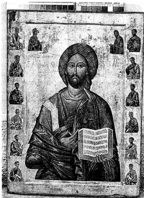
Рис 2. Ікона «Христос Пантократор з апостолами» XV ст. (РОКМ).

який належить до тієї не чисельної славної когорти українських митців, які найглибше правдиво проникають в суть духовності свого народу, його мистецтва, і взагалі культури. Адже, іконописець – це водночас і висококваліфікований майстер, і вчений-дослідник, і психолог. Все й не перерахуєш. Іконописець – універсал, у доброму значенні фанат своєї справи, до якої йде багато років, пам'ятаючи «не хлібом єдиним...».