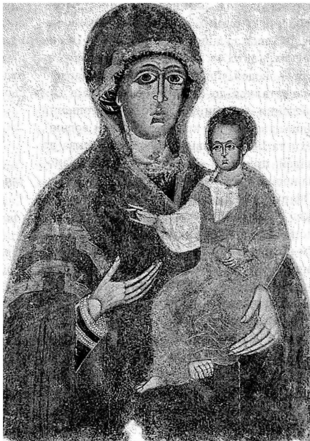
Рис 1. Ікона Дорогобузької Богородиці Одигітрії XIII ст. (РОКМ).

В період з 1980 по 2007 рр. відбулося близько 45 виставок, в яких художник брав участь, 25 з яких – персональні (в Гощі, Рівному, Мирогощі Дубенського району, Пляшеві Радивилівського району, Луцьку, Синьові Гощанського району, Києві). Неодноразово художник побував на виставках за кордоном: в Москві (1985, 1989, 1990 рр.) та Празі (Чехія, 1989 р.), зокрема в 1989 р. митець взяв участь в художній виставці в Чехії (центральный музей МВС СРСР). Буквально через рік відбулася персональна виставка Олександра Лаворіка в Москві (центральный музей МВС СРСР). З