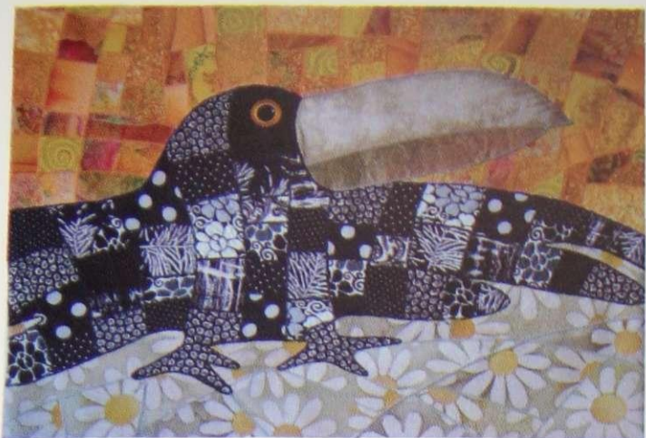
ІРИНА ШКАНДЕ (ЧЕРНІВЦІ) «ТЕКСТИЛЬНИЙ ПТАХ», колаж, 82x64, 2015 р.