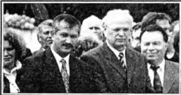
На святкуванні 900-річчя м.Дубна (серпень 2000 р.)

Я пурхав кімнатами пташком веселим, Дверима гамселив, гадав, що побачу Ну хоч би одне янголятко під стелею, Ну хоч би пір'їночку янголячу.