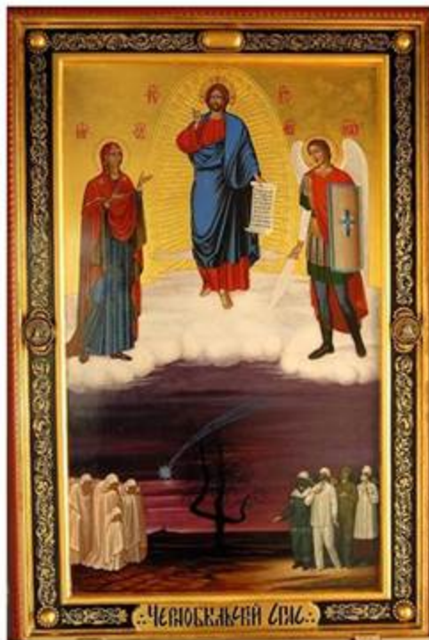
Ікона «Чорнобильський Спас». Дерево, левкас, позолота, темпера. Живопис. 2012 р.