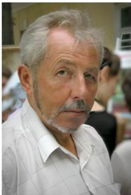
Лаворик О. Р. 2012 р.