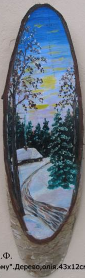
Лаворик Н.Ф. "Дорога додому". Дерево, олія. 43x12см. 1977р.