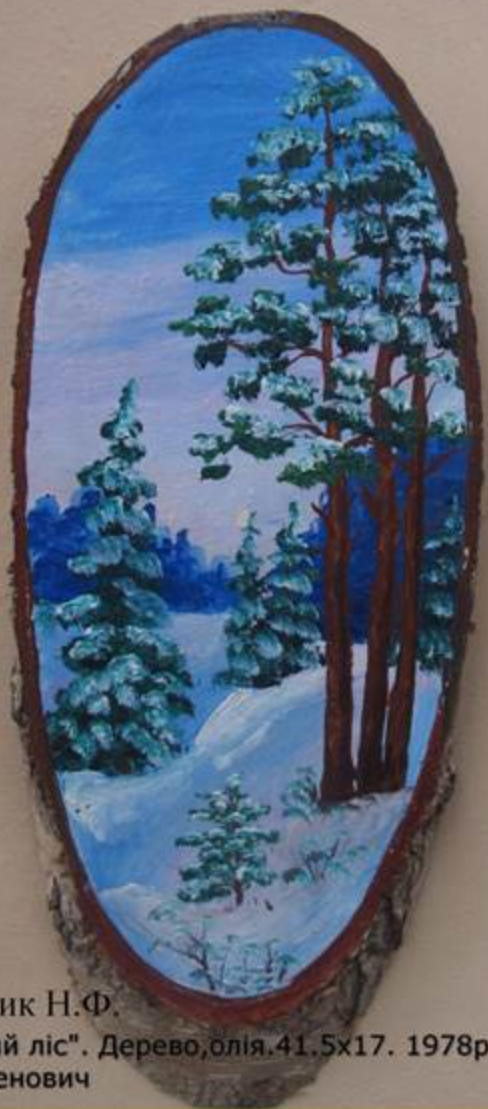
Лаворик Н.Ф. "Зимовий ліс". Дерево, олія. 41.5x17. 1978р.