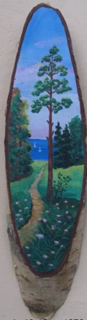
Лаворик Н.Ф. "Весною". Дерево, олія. 46x12 см. 1976р.