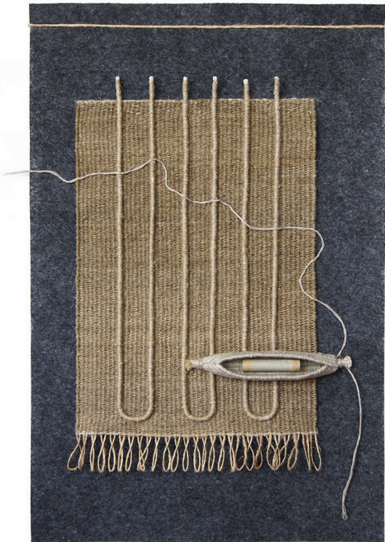
Lukaszewicz T. Wedrówki w czasie i obszarze...